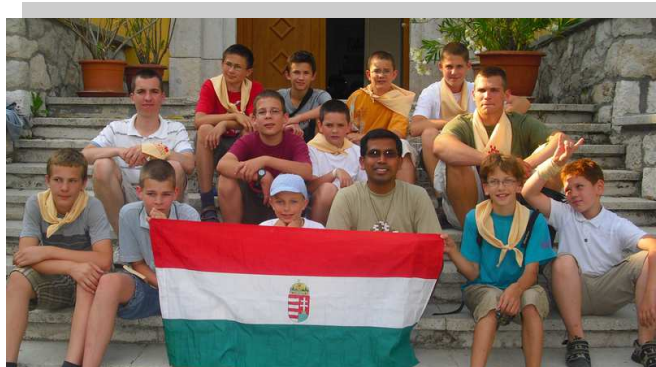
Cl. De Rossi Raja Indiano, misionero en Hungría

Y otra cosa que he asumido es que como misionero es importante mi esfuerzo por inculturarme con paciencia y humildad a cualquier lugar que me manden, sea la India, Hungría o cualquier otra parte del mundo, para poder llevar a Jesucristo a la gente a la que me envíen, para compartir con ellos el amor de Don Bosco a los jóvenes mediante el sistema preventivo de educación.