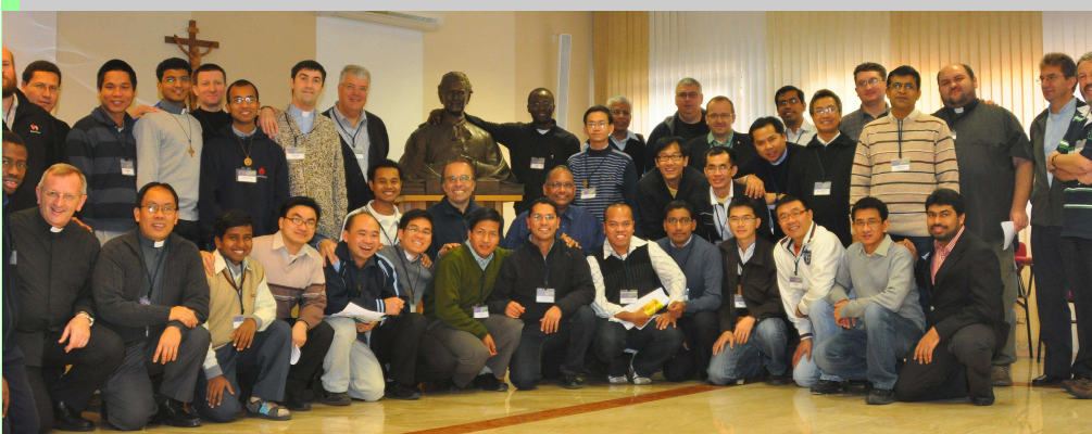
Participantes en el primer encuentro de misioneros salesianos en Europa, en Pisana, 25-27 nov. 2011

Todo esto debería ayudar a los Salesianos que trabajan en este contexto a lograr una mentalidad cada vez más europea, robustecer la sinergia entre las Inspectorías en los diversos sectores y reforzar la colaboración a nivel Regional». Entonces, ¿Qué puedo ofrecer por el Proyecto Europa?